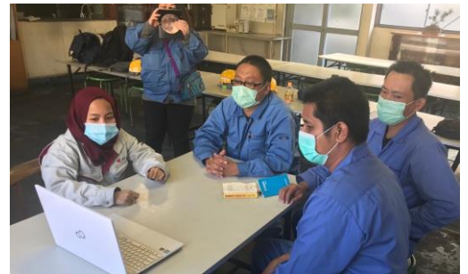
ORJ スタッフによる対面通訳

また、これまでも外国人就労者の受け入れの手続きや課題が山積みで、雇用主からは「必要なときに連絡が取れない」「災害時の対応が不安」等の声が、外国人就労者からは「日本の習慣が理解できない」「母国に送金する方法がわからない」といった悩みが多く寄せられました。